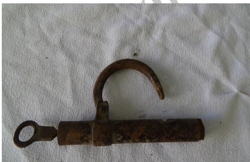
عکس ۷- قفل و کلید لوله‌ای