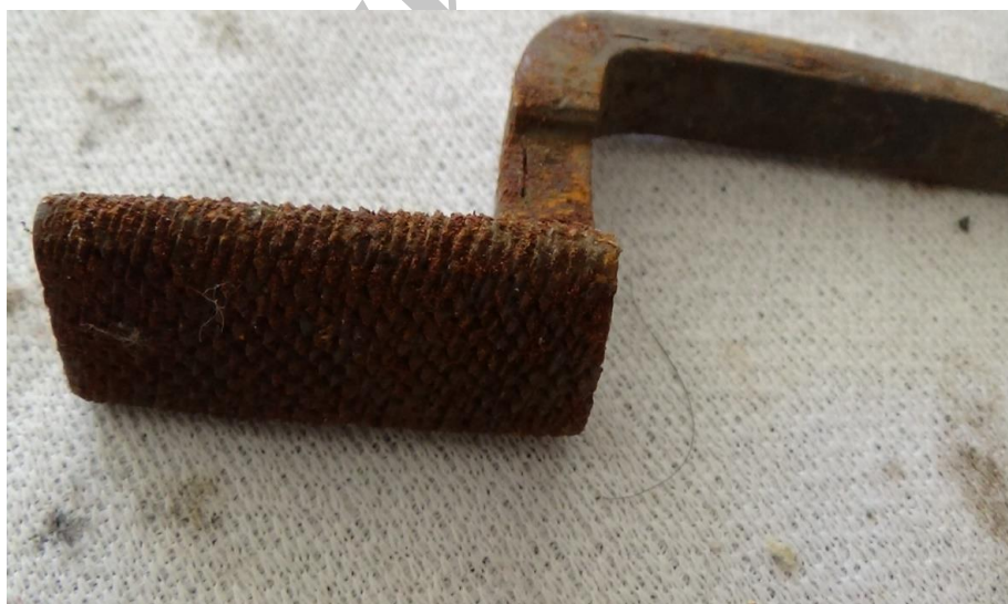
عکس ۳- سوهان چوب ساب