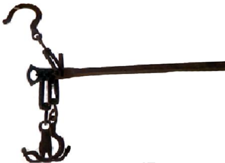
عکس ۶- قبان

ساخت اولین دست مصنوعی در غرب ایران ... ۱۷