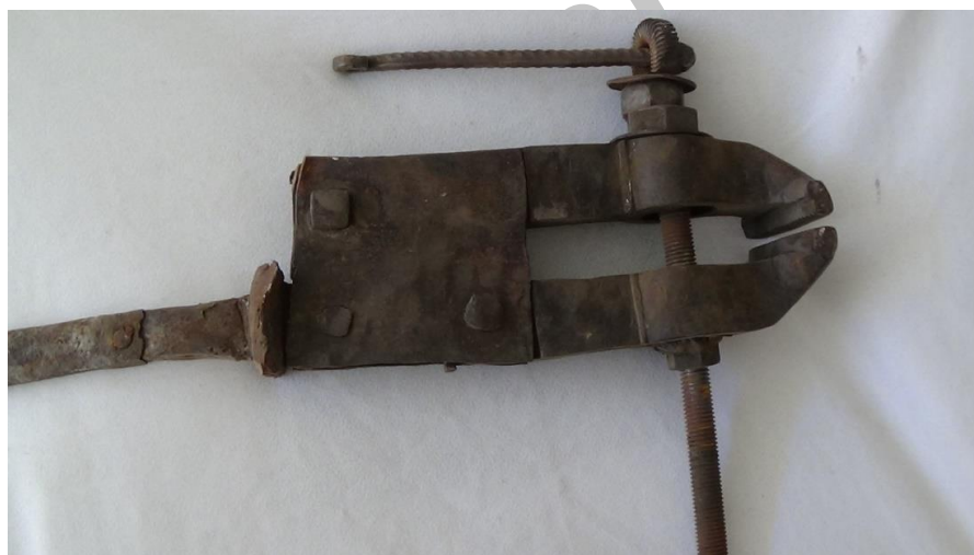
عکس ۵- گیره