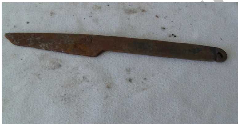
عکس ۲- کارد قالبیابی

این نظر و رویکرد در واقع درست بوده و صوفی محمد کار مردم شهر را روبه راهی کرده است. خوشبختانه بعضی از تولیدات صنعتی این هنرمند صنعتگر هنوز در اختیار نوادگانش قرار دارد که در ادامه بخشی از آنها نمایش داده می‌شود.